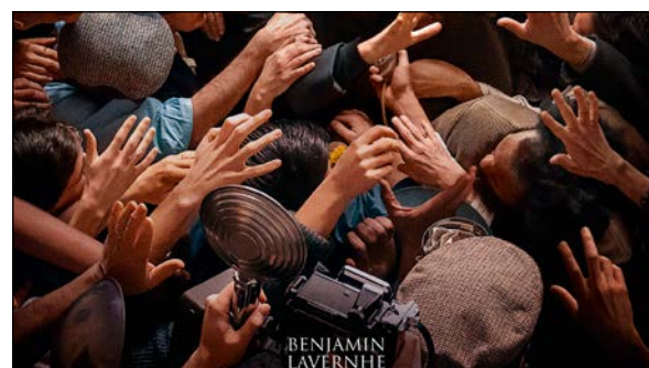
L'abbé Pierre, à l'affiche du festival du cinéma chrétien de Bayonne