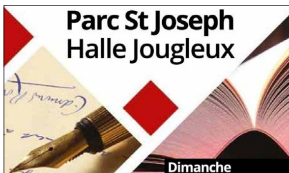
6e salon du livre de Cambo