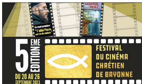
5e édition du festival du cinéma chrétien de Bayonne